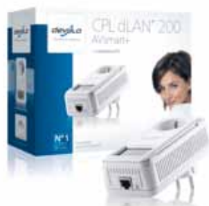
dLAN® 200 AVsmart+ Starter Kit