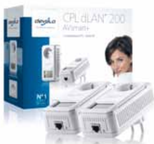
dLAN® 200 AVsmart+

Pour cet adaptateur montre l'état de la connexion avec les autres adaptateurs Powerline.